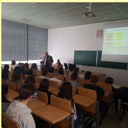
WSPÓŁPRACA Z UCZELNIAMI I INSTYTUCJAMI