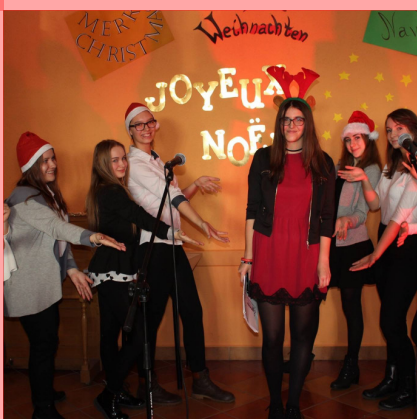
IMPREZY JĘZYKOWE I INNE